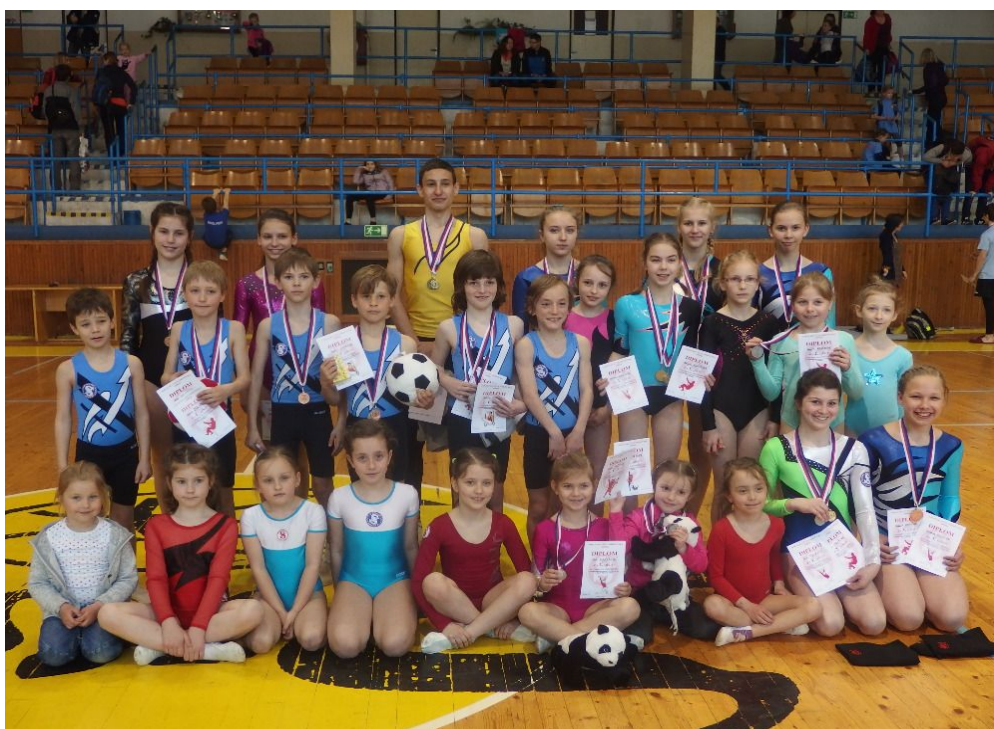
Přebor SŽJ ve sportovní gymnastice a šplhu - Písek