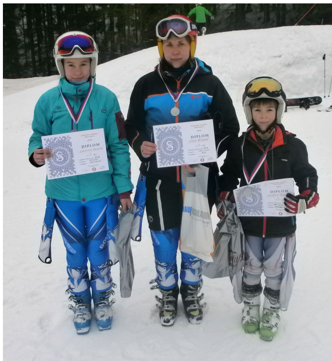
Přebor ČOS v alpském lyžování – Krkonoše