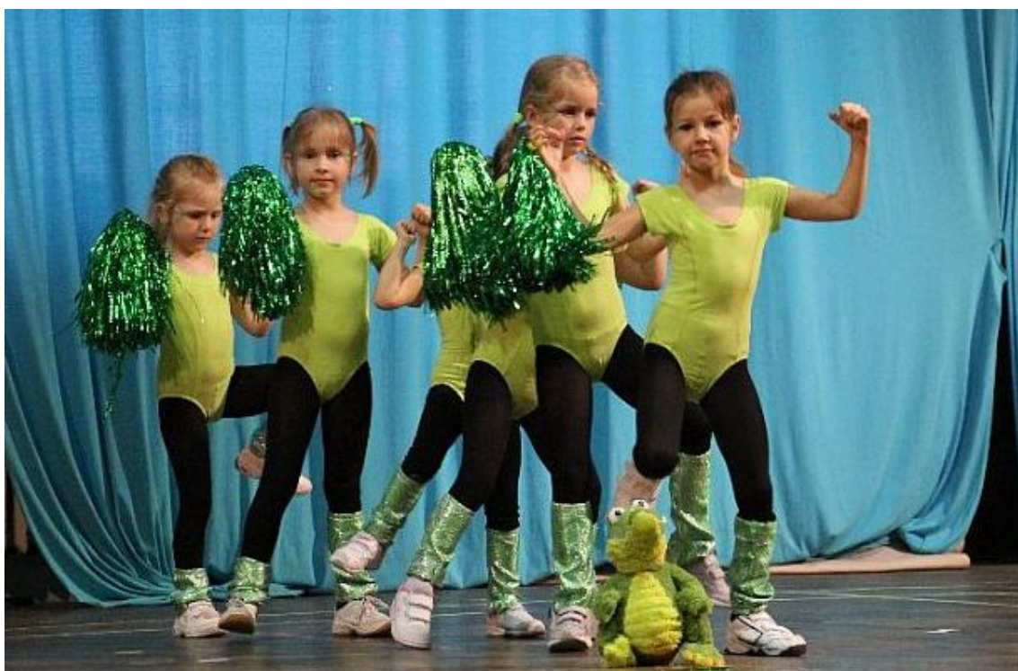
Předškolní děti z Hluboké nad Vltavou si na pódium přinesly maskota - krokodýlka.