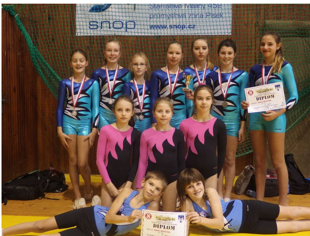
Malý TeamGym – Písek