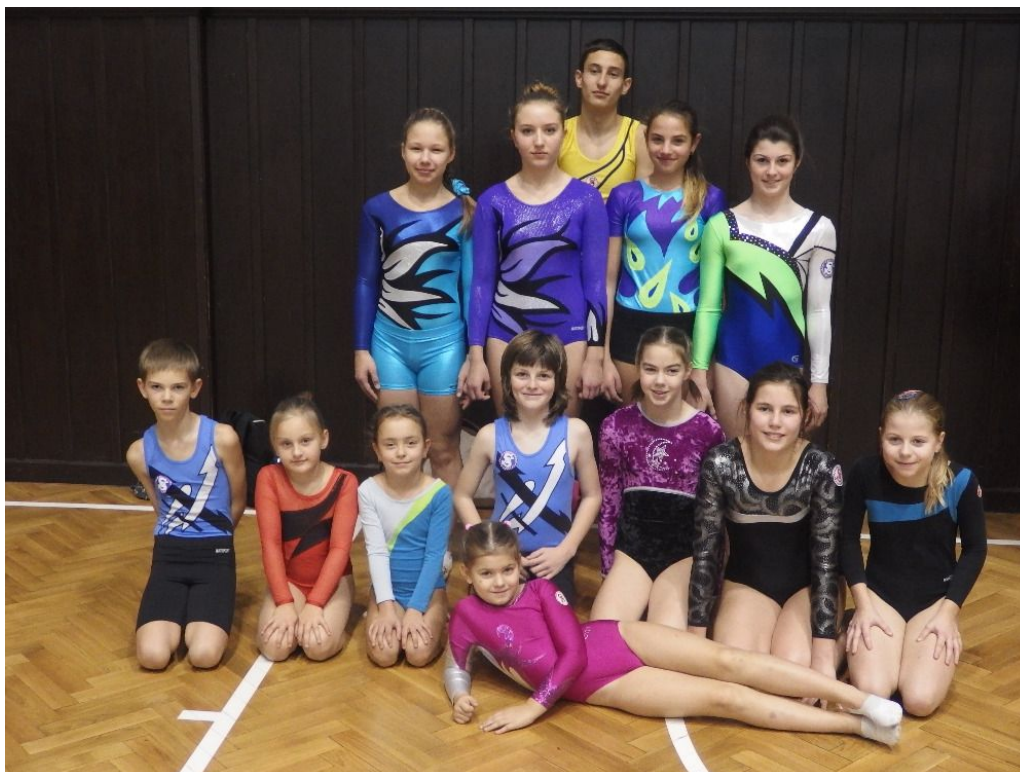
Memoriál Ády Hochmana – Praha