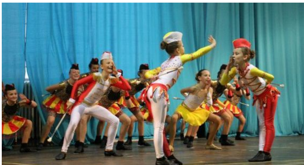
Mažoretky z Blatné sklidily aplaus za krásu, náročnost a neuvěřitelnou přesnost vystoupení.