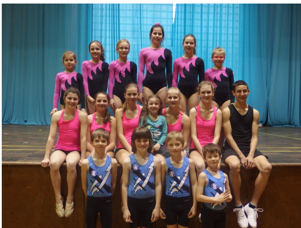
Župní akademie České Budějovice