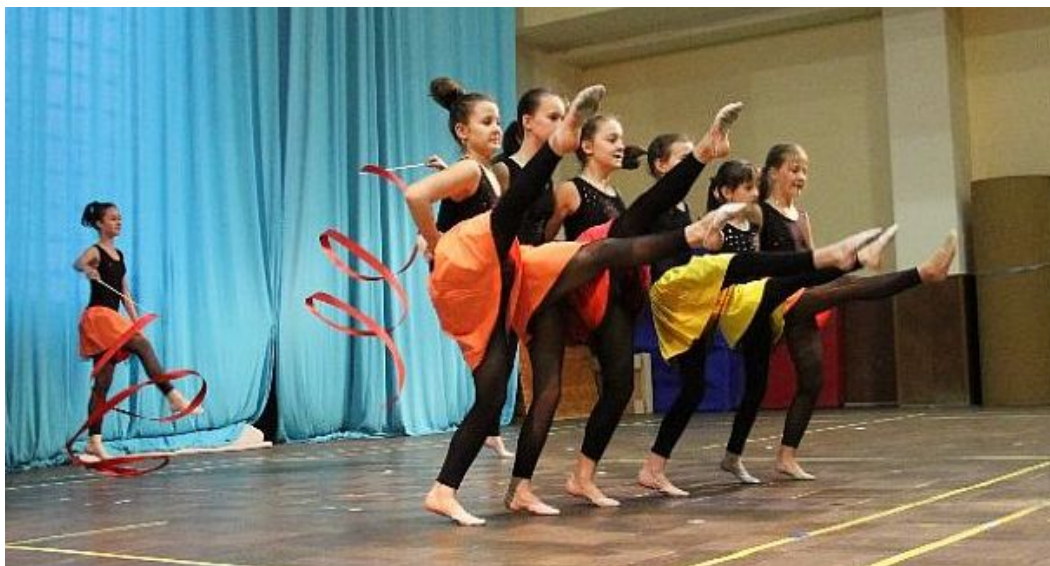
Moderní gymnastky z Tábora předvedly svižný sportovní kankán.

byla asi významnou župní akcí v loňském roce. Proběhla úspěšně, 10 jednot v ní předvedlo 16 skladeb, vystoupilo 170 cvičenců, přítomno bylo přes 200 diváků. Zahájil ji náměstek primátora Českých Budějovic Petr Podhola a starosta župy Stanislav Matoušek. Akci nám připomenou ukázky z některých skladeb: