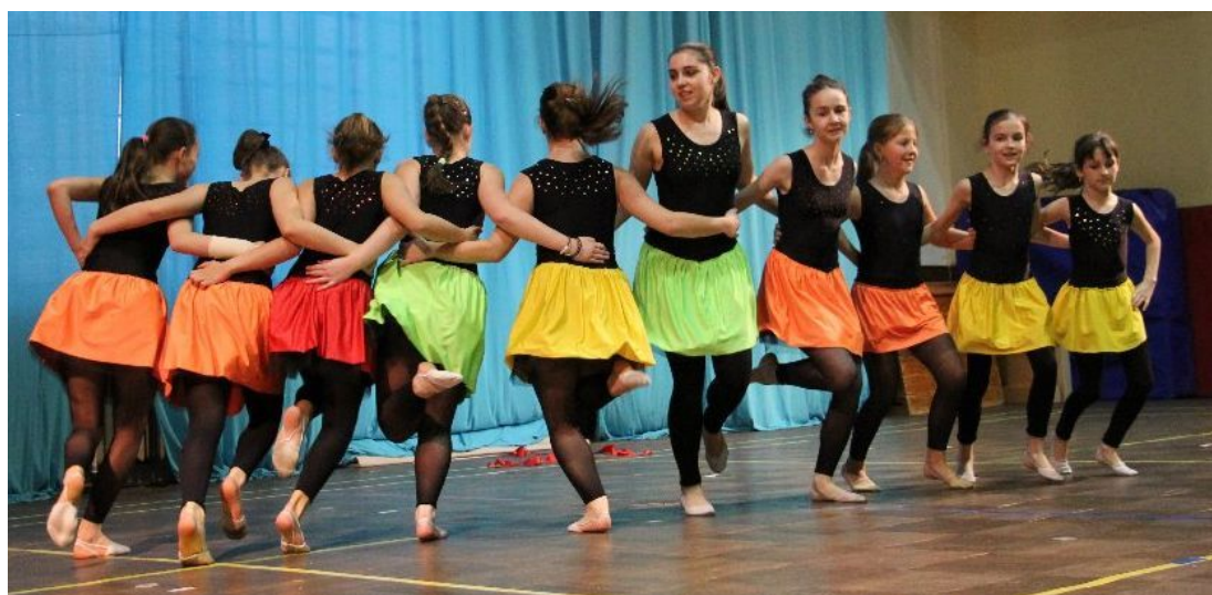
Vystoupení Župní akademie České Budějovice

V březnu 2016 oddíl moderní gymnastiky uspořádal pohárový závod v základním a kombinovaném programu – Velikonoční kraslice. Tábořská sokolovna přivítala závodnice z celé republiky. Na gymnastickém koberci se střetlo na 150 závodnic. Další významnou akcí byla listopadová Velká cena Tábora v moderní gymnastice.