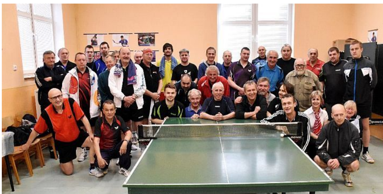
župní přebor ve stolním tenise

Naše sportovní oddíly se zúčastňují republikových i mezinárodních soutěží. Župní soutěže jsme uspořádali pouze v těch druzích sportu, ve kterých má župa alespoň 4 oddíly. Mimo to řada jednot pořádala finálové přebory ČOS. Pořadatelství přeborů ČOS bylo našim jednotám svěřeno na základě jejich vysoké sportovní úrovně i organizačních schopností.