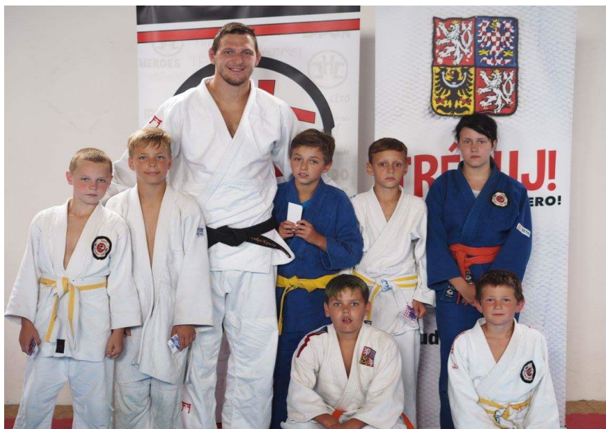
Naši judisté a olympijský vítěz Lukáš Krpálek

V listopadu se konal podzimní turnaj pro závodníky mládežnických a dorosteneckých kategorií. Barvy tábořského oddílu hájilo 15 judistů, kteří se v domácím prostředí prezentovali skvělými výkony. V konečném hodnocení získali 11 medailí z toho šest zlatých, tři stříbrné a dvě bronzové.