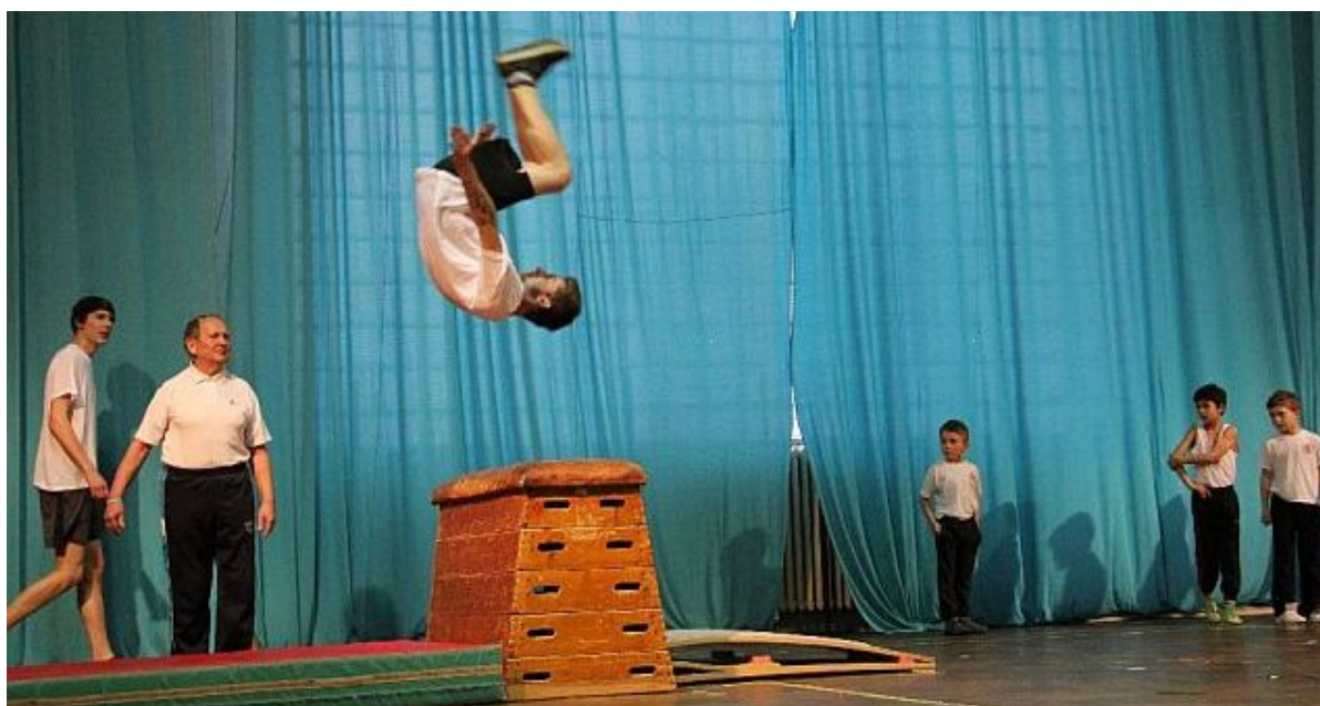
Sehraná parta chlapců a děvčat z Olešnice předvedla mohutné skoky přes švédskou bednu.