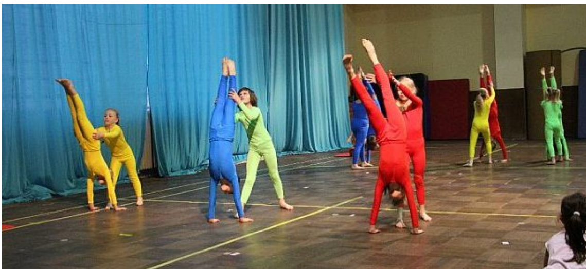
Chlapce a dívky ze Strakonice odměnilo publikum velkým potleskem za nápaditou skladbu Člověče, nezlob se, ve které děti v barevných kostýmech imitovali pohyb figurek po hrací ploše.