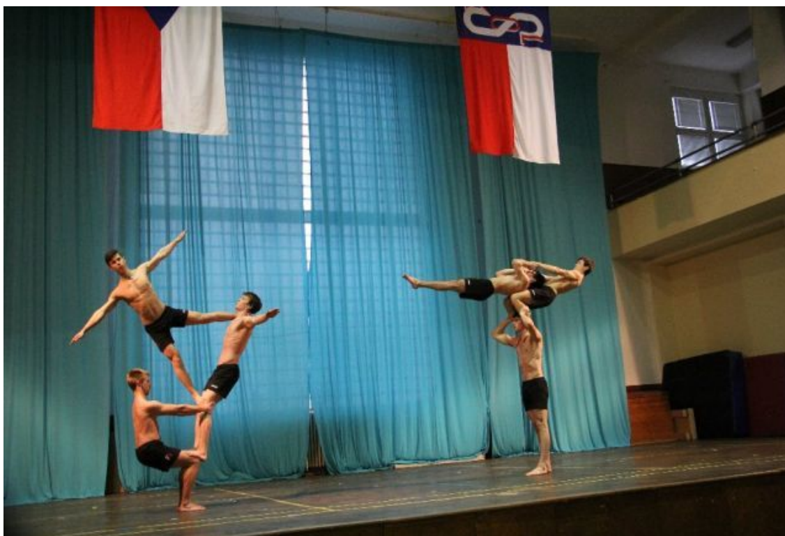
Největší ovace zaslouženě sklidili mladí muži z Písku za skladbu, ve které předvedli mimořádně náročné a perfektně provedené cvičení silové gymnastiky, především živé pyramidy.