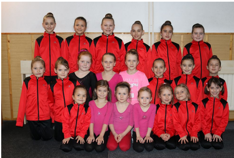
Členky oddílu moderní gymnastiky