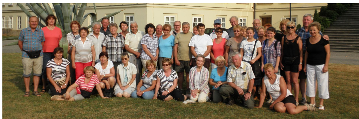
Letní turistické putování