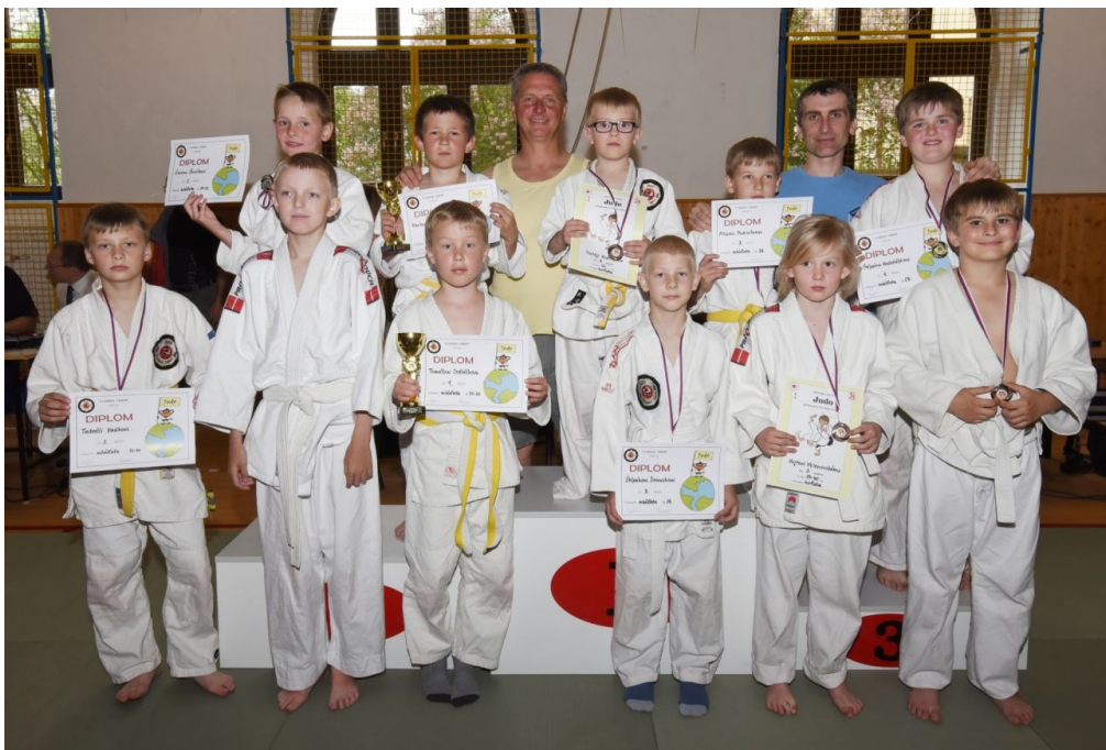
Závodníci Sokola na domácím turnaji

V listopadu se konal podzimní turnaj pro závodníky mládežnických a dorosteneckých kategorií. Barvy tábořského oddílu hájilo 15 judistů, kteří se v domácím prostředí prezentovali skvělými výkony. V konečném hodnocení získali 11 medailí z toho šest zlatých, tři stříbrné a dvě bronzové.