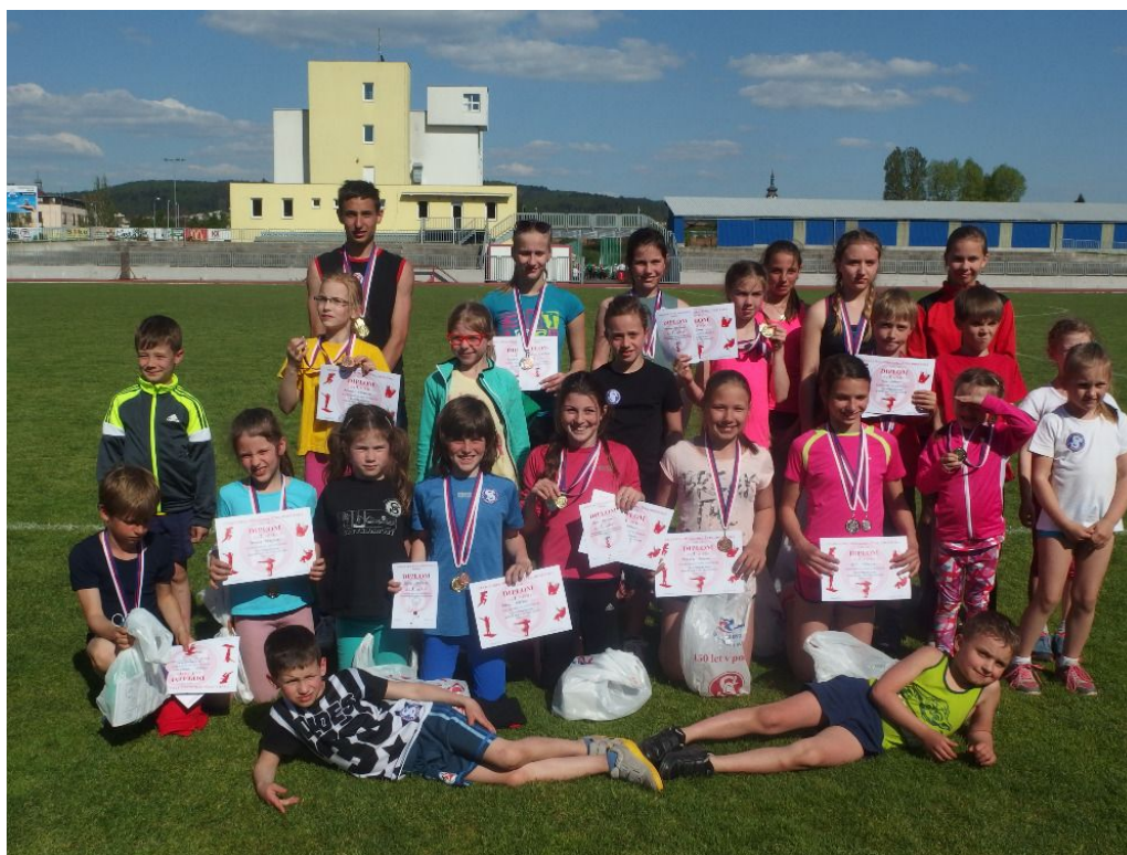
Přebor SŽJ v atletice – Písek